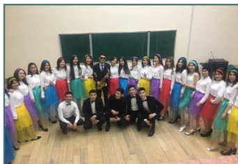
Конкурс на лучшую студенческую группу

На факультете функционируют студенческие самоуправления, такие как студенческий совет, студенческий маслихат и Студенческая профсоюзная организация «Сункар». Иногородние студенты обеспечиваются общежитием.