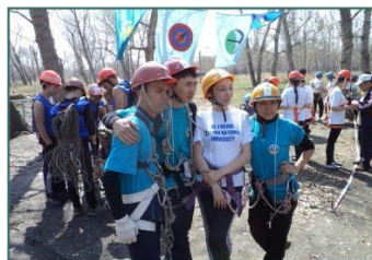
Соревнования по туристскому многоборью