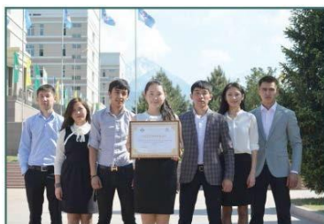
Победители Международной научной конференции